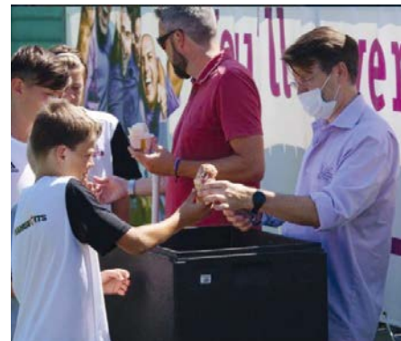
Erst der Jubel, dann die leckere Belohnung von der Konditorei Hagmann