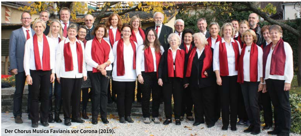
Der Chorus Musica Favianis vor Corona (2019).

Und wer gerne mitsingen möchte, ist herzlich eingeladen, unseren Chor zu verstärken. Wir proben jeden Dienstag um 19:30 Uhr und freuen uns schon sehr auf Euch!