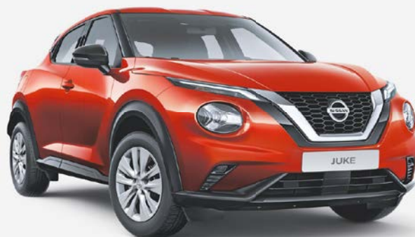
Nissan Juke Visia DIG-T 117 6MT, 86 kW (117 PS)

Sag auf Japanisch „Hallo“ zu 5 Jahren Garantie 1 und einem Angebotspreis von € 16.530,- 2