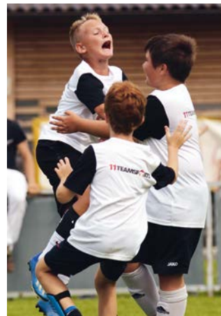
JHG NW-Mitte: Jugendhauptgruppe Nordwest-Mitte besteht aus Vereinen der politischen Bezirke, Krems, Tulln und St. Pölten-Land (Wien-Umgebung)