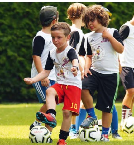
Volle Konzentration beim Sparkasse Römercamp 2020