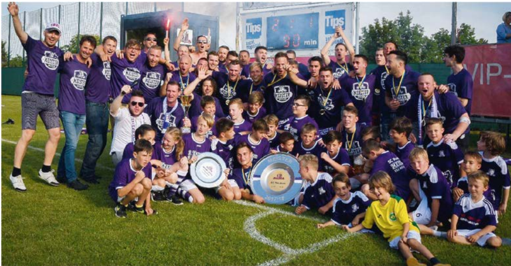
Neben den steten baulichen Adaptierungen wie zB. Der Modernisierung des Vereinslokals und den Umbau in das „Violetta“ ist aber die kontinuierliche Entwicklung der Nachwuchsarbeit der größte Erfolg.

Waren es noch vor 10 Jahren 3 Nachwuchsmannschaften mit 4 Trainern, so tummeln sich heute 8 Nachwuchsteams mit mehr als 100 Kindern am Platz. Betreut von 16 ausgebildeten Trainerinnen und Trainern, die nach einem prämierten Ausbildungskonzept arbeiten. Dabei können wir derzeit durchgehend alle Jahrgänge von 2006 bis 2015 abdecken. Herzstück dabei ist die Bambini-Gruppe, in der Kinder im Alter von 3,5 bis 6 Jahren von ausgebildeten Pädagoginnen spielerisch an den Fußball-