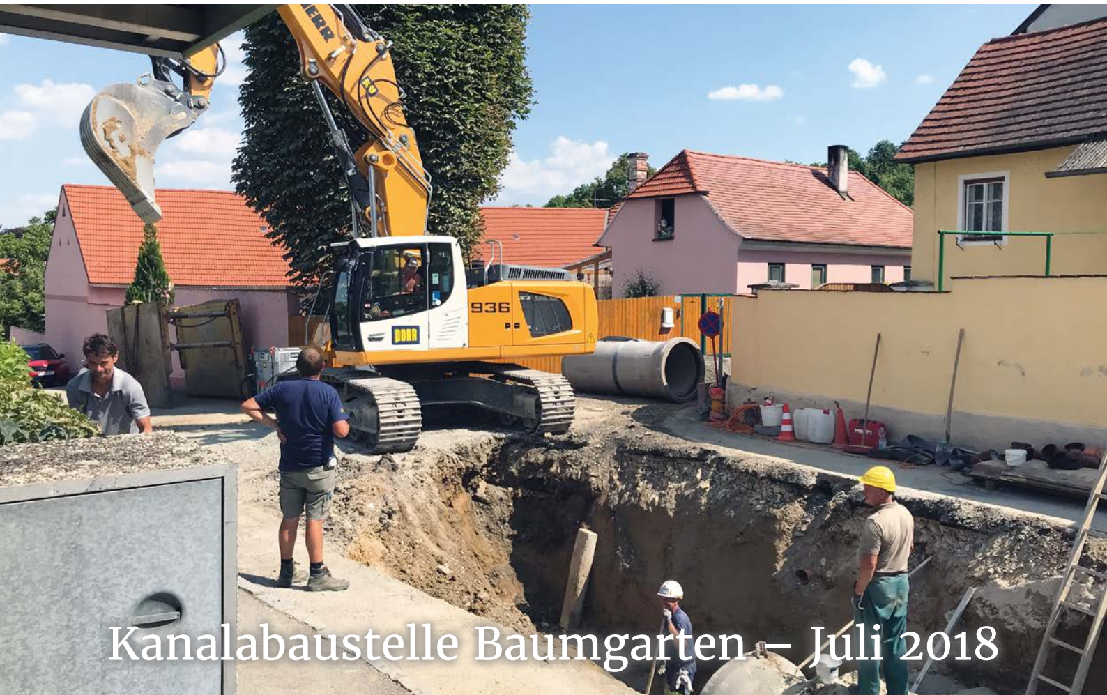
Kanalabaustelle Baumgarten – Juli 2018