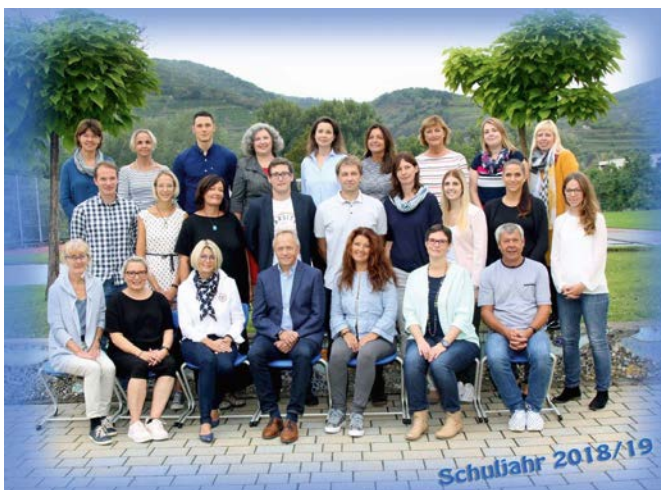
Das Lehrerteam der Sport- und Europamittelschule Mautern im Schuljahr 2018/19