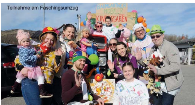
Teilnahme am Faschingsumzug

Unser Sonnwendfest findet heuer am 20. und 21. Juni in bewährter Weise statt.