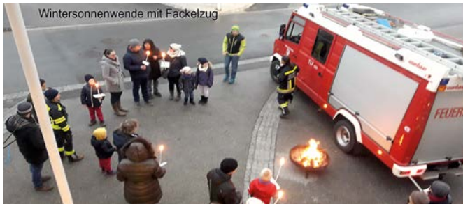
Wintersonnenwende mit Fackelzug