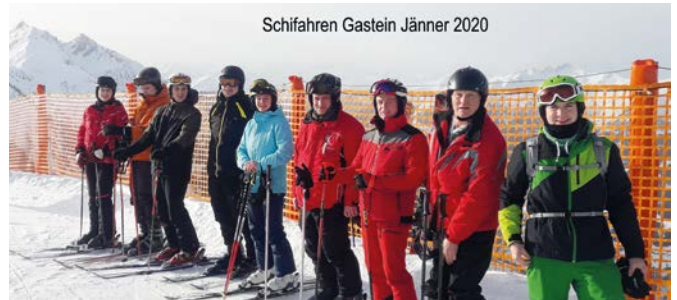
Schifahren Gastein Jänner 2020

Traditionell beendeten die Feuerwehr Baumgarten das Feuerwehrjahr mit der Abhaltung der Wintersonnenwende. Vielen Dank an alle Gäste, die uns im Feuerwehrhaus besucht haben und am Fackelzug zum Sonnwendplatz mitgegangen sind. Ein herzliches Dankeschön gilt auch allen Gönnern, die uns anlässlich der Überbringung der Neujahrswünsche mit einer Spende unterstützt haben.