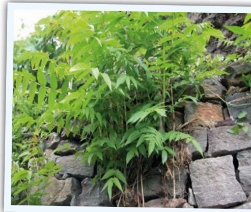
Kleine Götterbäume auf Trockenmauern in Stein.

ersucht Grundbesitzer und Hobbygärtner auf die Pflanzung von Götterbäumen zu verzichten, kleine Bäume und Schösslinge möglichst mit Wurzel auszureißen und größere Bäume im späten Frühjahr und Frühsommer zu ringeln oder auszugraben. Wenn man die Bäume nur abschneidet, muss man viele Jahre lang mit Stockauschlag und zahlreicher Wurzelbrut rechnen. Besonders hartnäckig ist der Götterbaum auf Weingartenböschungen und in Trockenmauern. Deshalb und da er auch ein Wirt für die Goldgelbe Vergilbung ( flavescence doree ) sein kann, sollte man ihn im Weinbau unbedingt bekämpfen. Seit wenigen Jahren wird