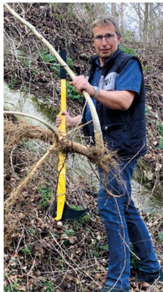
Götterbäume am besten immer mit der Wurzel ausreißen, beispielsweise mit einem Treepopper.

Dennoch wird der invasive Götterbaum immer noch in Gärten und sogar im Wald ausgepflanzt. Hannes Seehofer, Naturschutzbeauftragter vom Verein Welterbegemeinden,