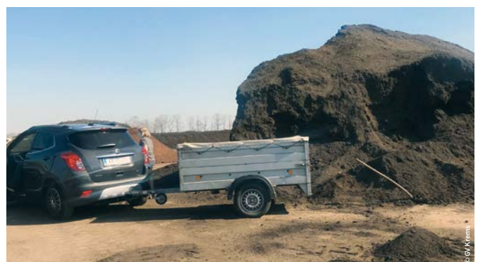
Eine von insgesamt fast 1.000 Kompostabholungen bei der Brantner-Kompostanlage in Langenlois/Gneixendorf.

Jedes Jahr im Frühjahr, wenn die Natur aus dem Winterschlaf erwacht, geht das große „Garteln“ wieder los. Um auch in der kommenden