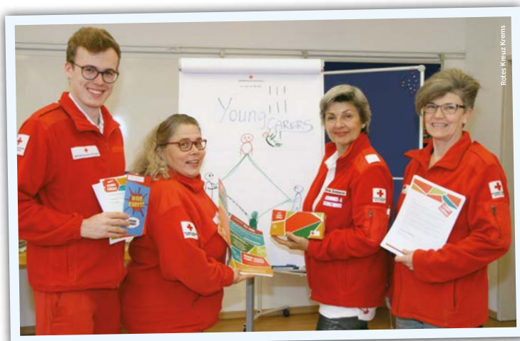
Rotes Kreuz Krems

tungsabfall in der Schule, lange Fehlzeiten bis hin zum Schulabbruch sind zu nennen. Da Young Carers wenig Zeit haben, ihre Freundschaften zu pflegen, ziehen sie sich nicht selten aus ihren Freunden*innen bzw. Mitschüler*innen zurück. Mit wem sollten sie auch