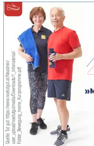
Quelle: Tut gut: https://www.noetutgut.at/fileadmin/user_upload/noetutgutmedia/Downloads/1_infomaterial/Folder_Bewegung_meine_Kurzprogramme.pdf