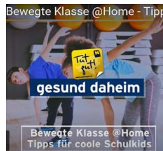
Quelle: Tut gut: https://www.noetutgut.at/aktuelles/gesund-daheim-im-eigenheim/

Bewegung und Gesundheit ins Wohnzimmer gebracht. Finden Sie Mitmachvideos für Kinder und Gesundheitstipps für Erwachsene .